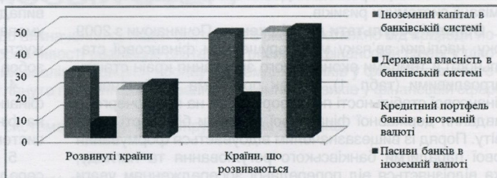
Рис. 1. Окремі характеристики банківських систем розвинутих країн та країн, що розвиваються, %

З точки зору забезпечення фінансової стабільності країни та ймовірності поширення системних ризиків, залежність країни від іноземного капіталу є загрозовою через можливість відтоку капіталу через погіршення економічної ситуації країни-донора. Стимулюючим фактором впливу на реалізацію системних ризиків є висока частка фінансових операцій, які здійснюються за допомогою іноземної для країни валюти й поширюються завдяки доступу фінансових установ до зовнішніх джерел фінансування.