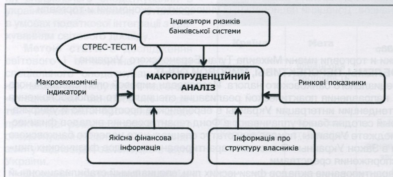
Рис. 2. Компоненти макропруденційного нагляду

темних ризиків через певні індикатори фінансового сектору і макроекономічні показники у країні, що продемонстровано на рис. 2.