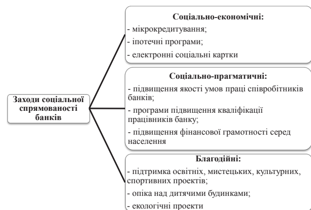
Рис. 1. Систематизація соціальних заходів банків

Наразі основні прояви соціальної активності банків охарактеризовані наступною схемою (рис. 1):