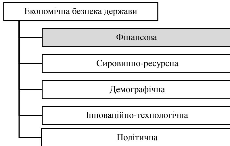
Рисунок 2 – Основні складові економічної безпеки держави (складено автором)

Перелічені складові тісно пов'язані між собою, із внутрішнім та зовнішнім середовищем. А їх зв'язки мають як прямі так і опосередковані. В рамках цих видів у державі обираються цілі, задачі, а так же визначають пріоритетні з них. В результаті чого виникає конфлікт інтересів при розподіленні ресурсів, реалізації цілей.