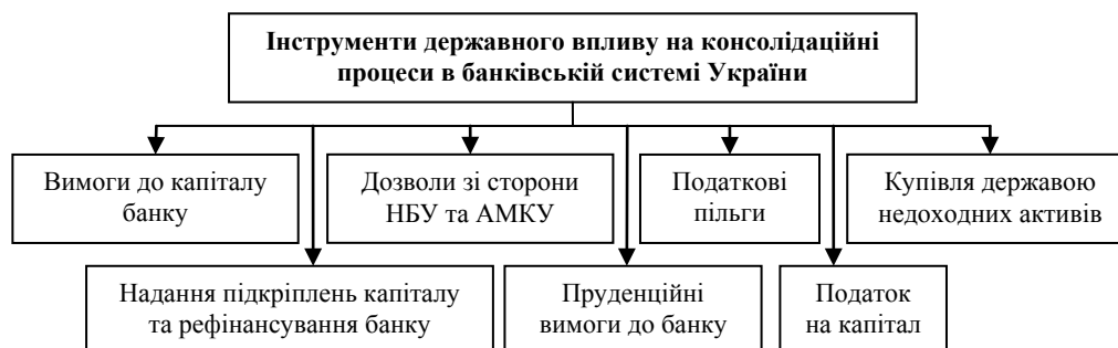
Рис. 1. Інструменти державного впливу на консолідаційні процеси в банківській системі України [авторська розробка]

Виклад основного матеріалу. Зі світового досвіду можна сформулювати доволі значний перелік інструментів державного впливу на консолідацію банків, однак не всі вони мають широке практичне використання та здатні викликати якісні та кількісні зміни в банківському секторі країни. Відповідно до української практики та особливостей регулювання діяльності банків в Україні надамо перелік тих інструментів, які, на наш погляд, можуть бути застосовані на сьогодні державою для стимулювання або стримування консолідаційних процесів у вітчизняній банківській системі (рис. 1).