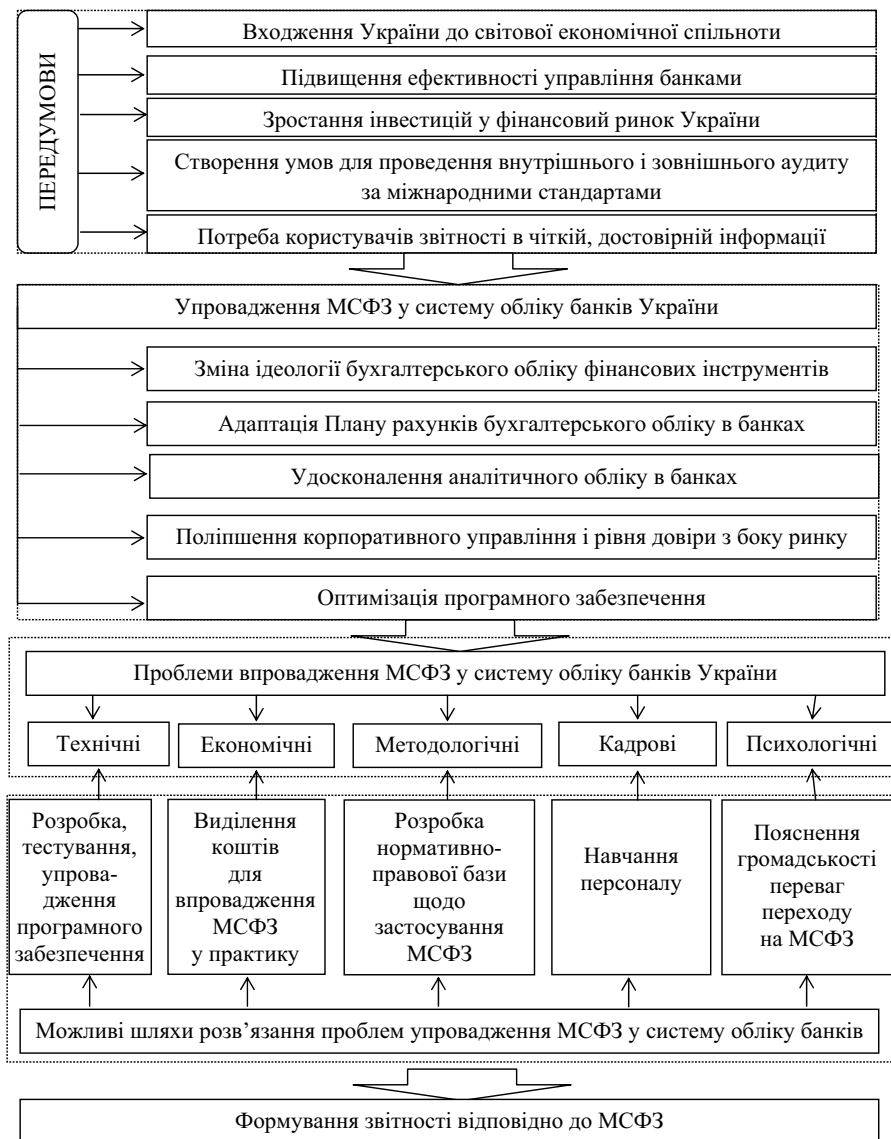
Рис. 2. Схема процесу адаптації фінансової звітності банків України до вимог за МСФЗ

їни; першочергові завдання, які треба було вирішити; проблеми, що виникають у процесі впровадження міжнародних стандартів; можливі шляхи розв'язання цих проблем і побудували схему процесу адаптації фінансової звітності банків України до вимог до МСФЗ (рис. 2).