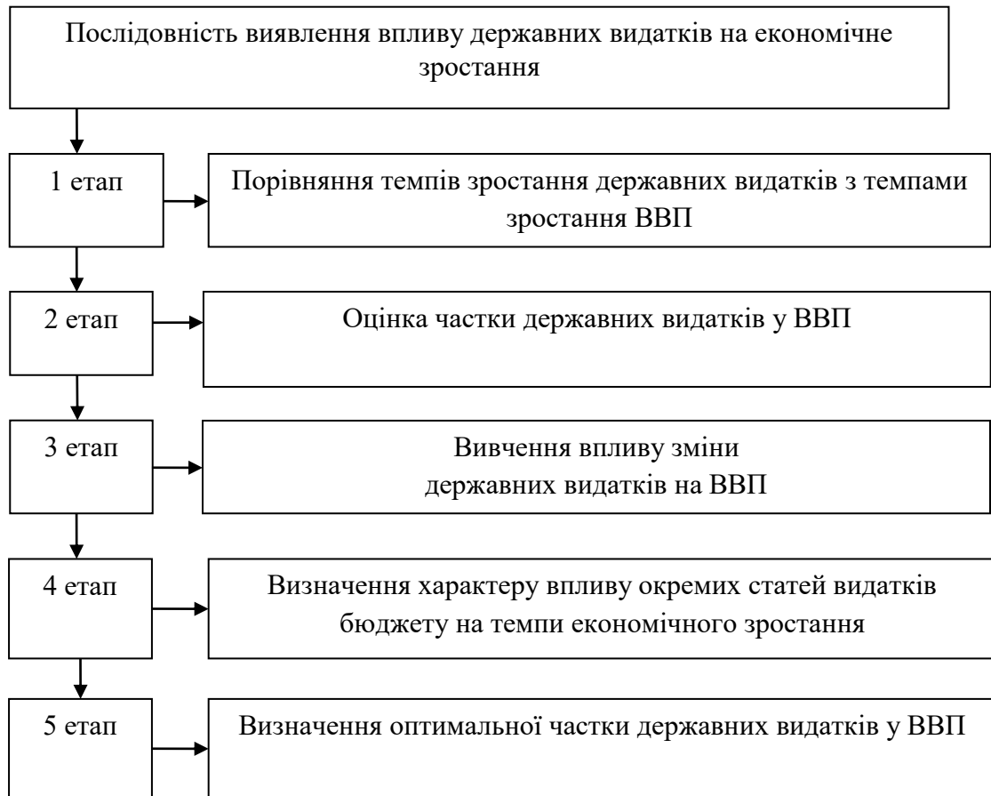
Рисунок 1 – Послідовність виявлення впливу державних видатків на економічне зростання

На першому етапі проведення аналізу впливу державних видатків на економічне зростання здійснюється визначення темпів зростання державних видатків та темпів зростання ВВП та їх співставлення. Інструментарієм для визначення зміни даних критеріїв є темпові показники рядів динаміки, а саме темп зростання. На основі розрахунку темпових показників зміни обсягу державних витрат та ВВП здійснюється оцінка рівня розвитку економічної системи країни.