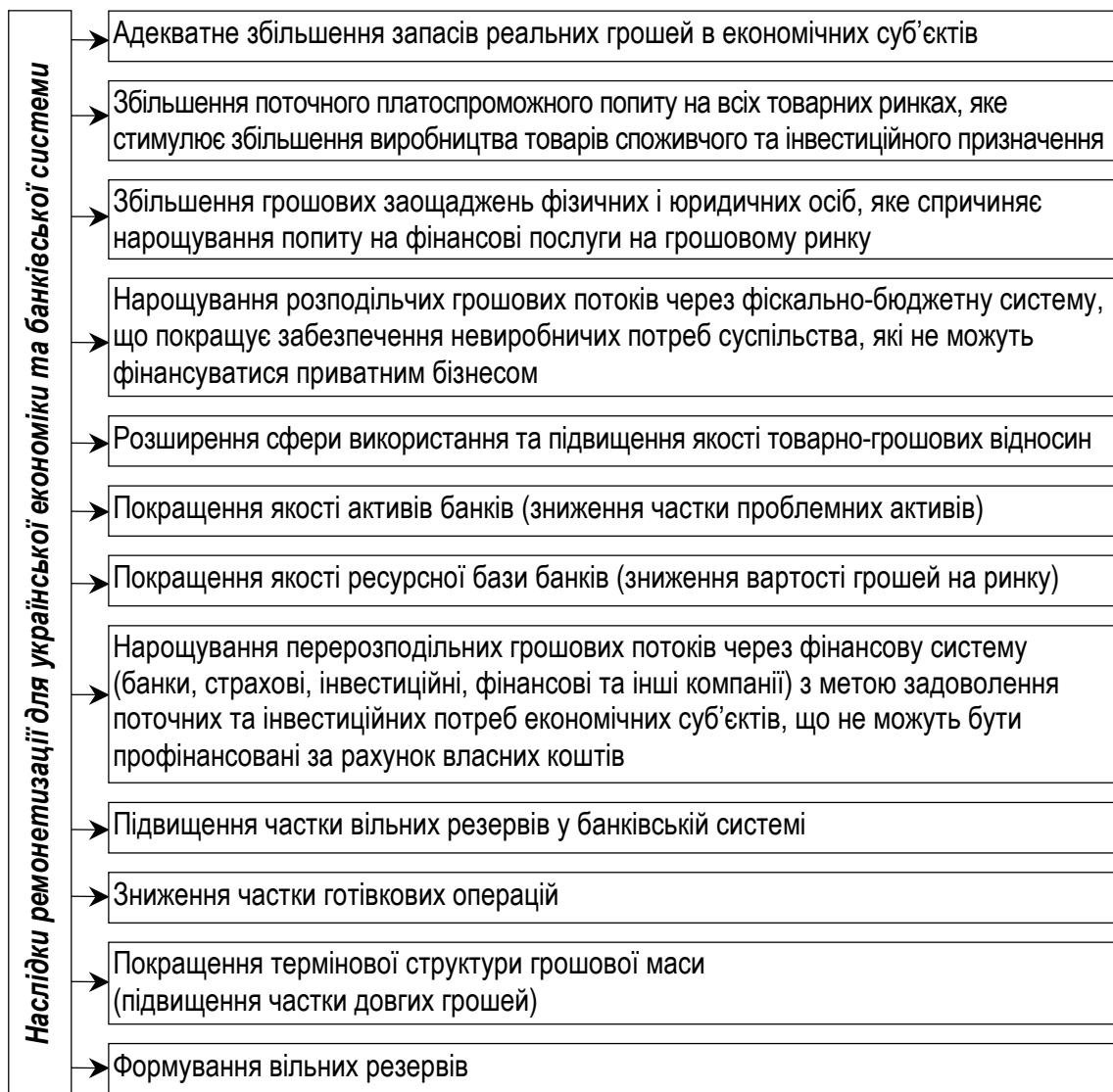
Рис. 3. Наслідки ремонетизації для вітчизняної економіки з точки зору можливостей формування й ефективного використання інвестиційного потенціалу банківської системи

Вплив ремонетизації економіки на інвестиційний потенціал банківської системи проявляється також і у формуванні вільних резервів, адже на макрорівні загальний обсяг банківських резервів визначається загальним обсягом грошової маси в обігу та її структурою. Чим більшою є маса грошей в обігу і чим нижчою – частка готівки в ній, тим вищою є межа формування резервів банків, які слугують ресурсною складовою інвестиційного потенціалу банківської системи. Відповідно на мікрорівні обсяги резервів визначаються результатами кожного окремого банку в мобілізації вільних коштів юридичних та фізичних осіб.