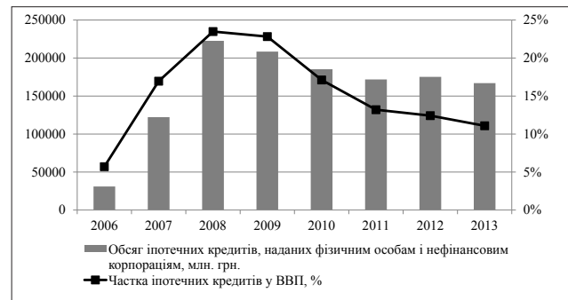
Рис. 1. Загальний обсяг іпотечних кредитів та їх частка у ВВП в Україні протягом 2006–2013 рр.

Аналізуючи динаміку загальних обсягів іпотечного кредитування в Україні у 2006–2013 роках (рис. 1), очевидним є стрімке нарощення обсягів наданих іпотечних кредитів з 2006 по 2008 рік [3]. У цей період поряд із досягненням високих темпів економічного зростання загалом, банки могли розраховувати на формування депозитного портфеля із значною питомою вагою вкладів терміном від 1 року. Як результат, обсяги виданих іпотечних кредитів за 2006–2008 рр. зросли приблизно у 7 разів, а їх частка у ВВП збільшилася з 5,7% до 23,5%.