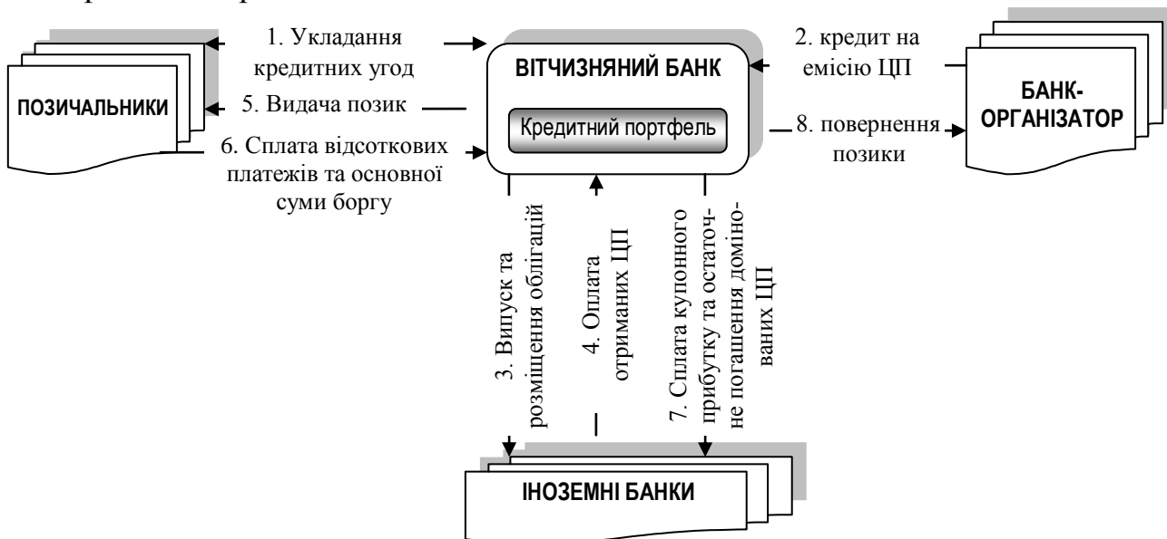
Рис. 3. Механізм реалізації накопичувальної сек'юритизації

Схематично механізм реалізації накопичувальної сек'юритизації відображено на рис. 3.