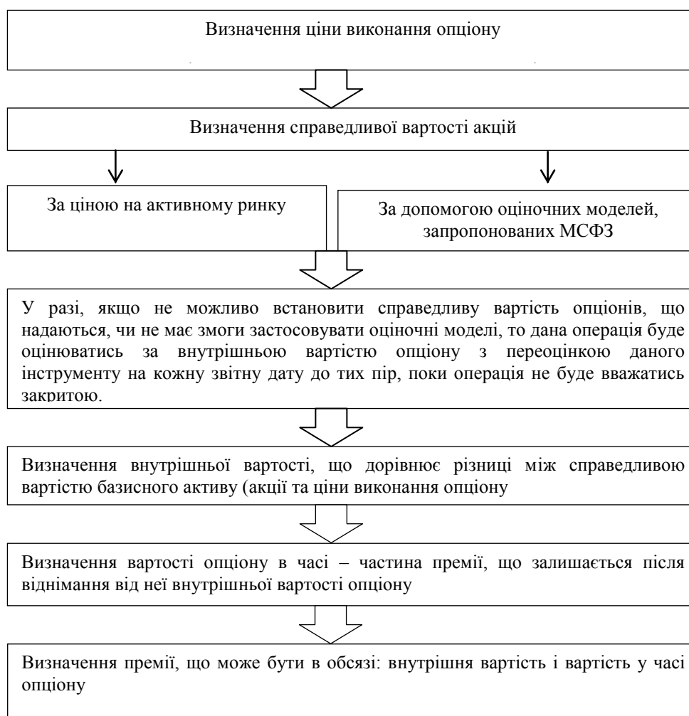
Рис. 2. Алгоритм визначення вартості опціону

На основі проведених досліджень пропонуємо алгоритм визначення вартості опціону, що наведений на рис.2, з деталізацією визначення внутрішньої вартості опціону на рис. 3