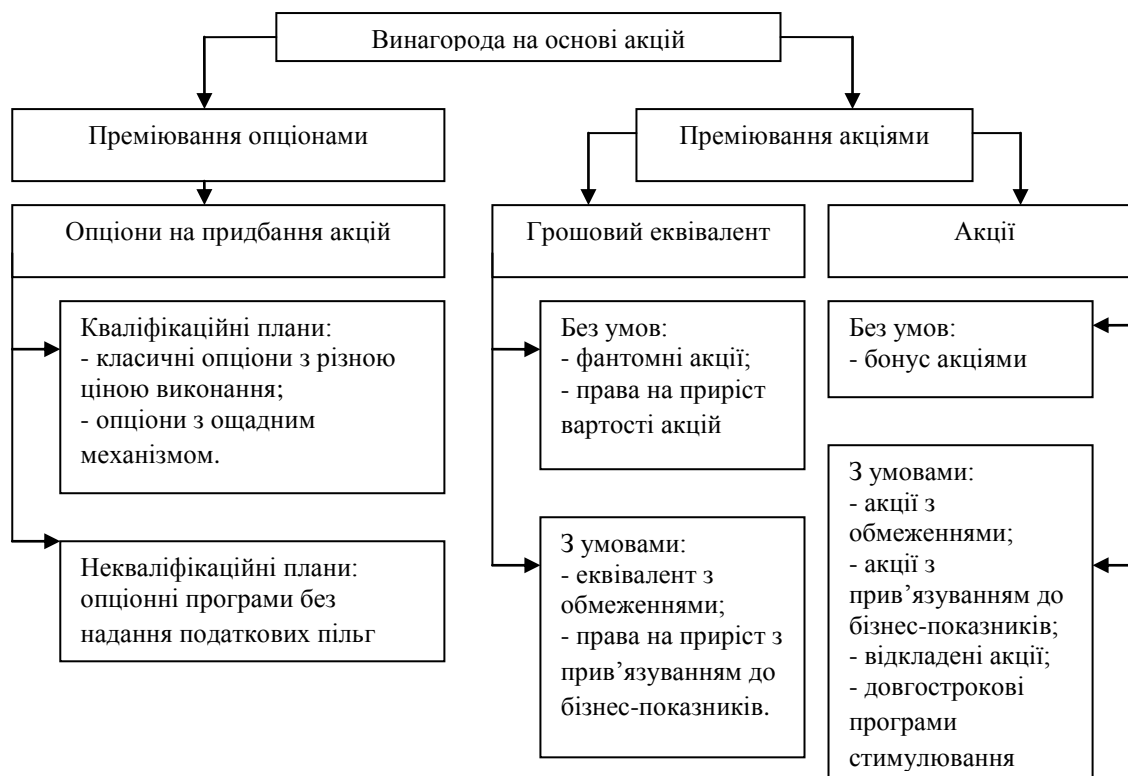
Рис. 1. Стимулювання працівників на основі акції в міжнародній практиці [3]

Розглянемо детальніше порядок стимулювання працівників такими видами ІВК як акції та опціони на акції. Існують різні схеми стимулювання працівників на основі акцій, що використовуються в міжнародній практиці (рис. 1).