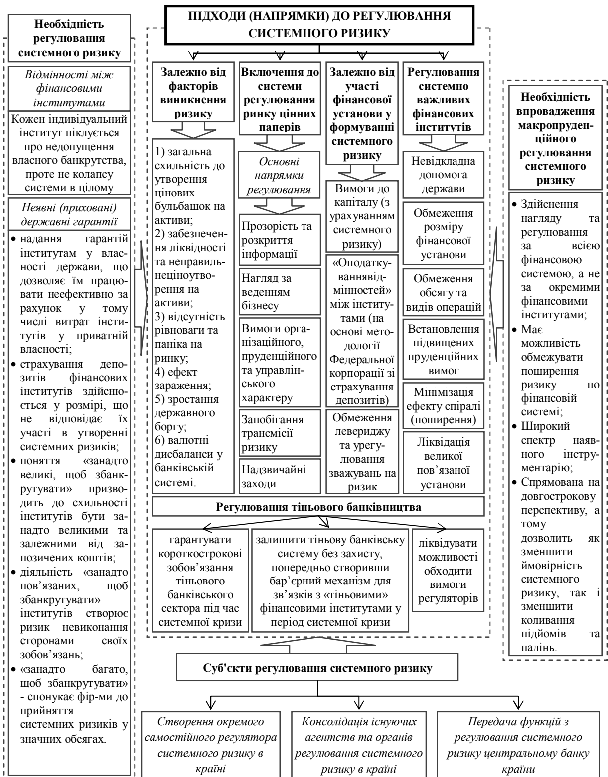
Рис. 2. Характеристика підходів (напрямків) до регулювання системного фінансового ризику (складено автором на основі [1, 4, 5, 6, 9, 10, 11, 12, 13])

Відзначимо, що сьогоднішні підходи до регулювання системного ризику тяжіють до побудови системи нагляду та регулювання за всією фінансовою системою в країні, поступово відходячи від практики нагляду за окремими фінансовими установами. У той же час зауважимо,