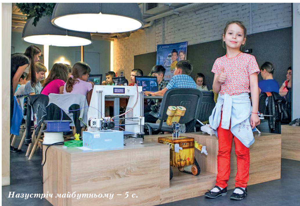
Назустріч майбутньому – 5 с.