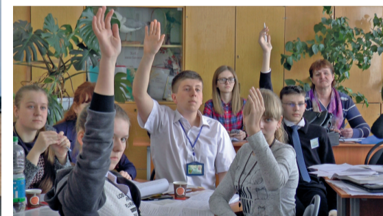
Турнірне відкриття першокурсників – 4 с.