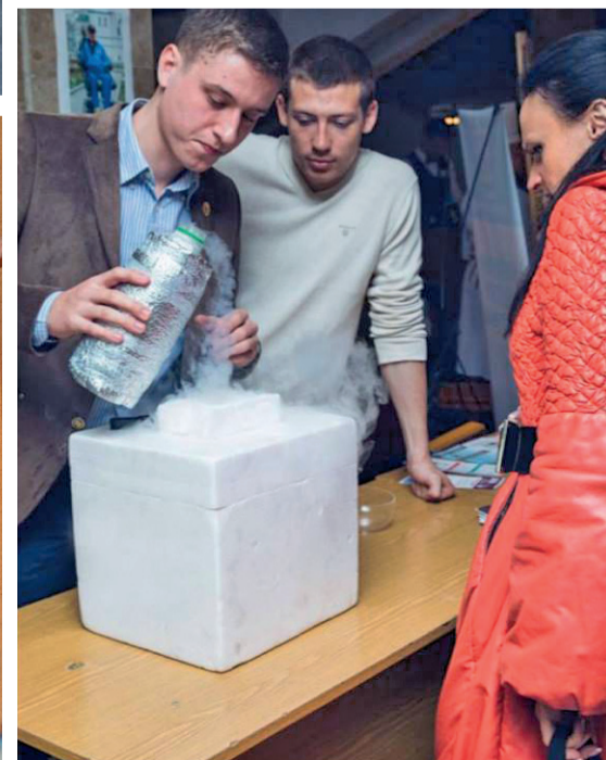
НТСА. Науковий пікнік – 3 с.