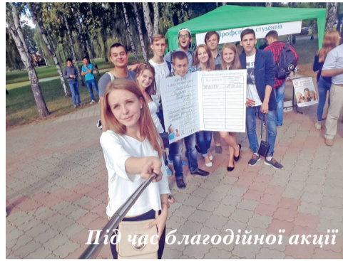
Під час благодійної акції

ППОС регулярно здійснює рейди-перевірки умов обслуговування в їдальнях, буфетах та кафетеріях університету, співставлення цін на продукцію з її