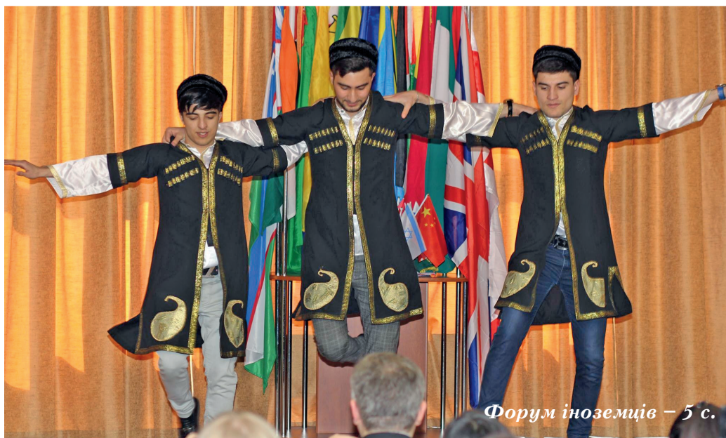
Форум іноземців – 5 с.