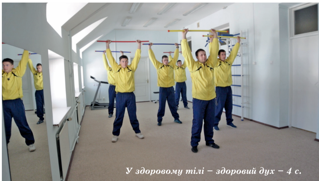
У здоровому тілі – здоровий дух – 4 с.

Там же – цікава інформація про урочистості з нагоди Дня науки, що відбулися в обласній філармонії. Під час їх проведення голова Сумської ОДА Микола КЛОЧКО вручив представникам науково-педагогічного колективу СумДУ почесні грамоти та подяки.