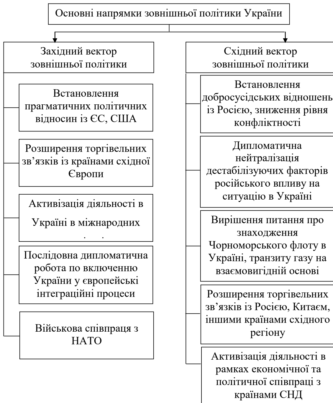
Рис. 2. Основні елементи зовнішньополітичного курсу України за умов «багатовекторності».

Схематично багатовекторну стратегію розвитку зовнішньої політики України можна представити таким чином (рис. 2).