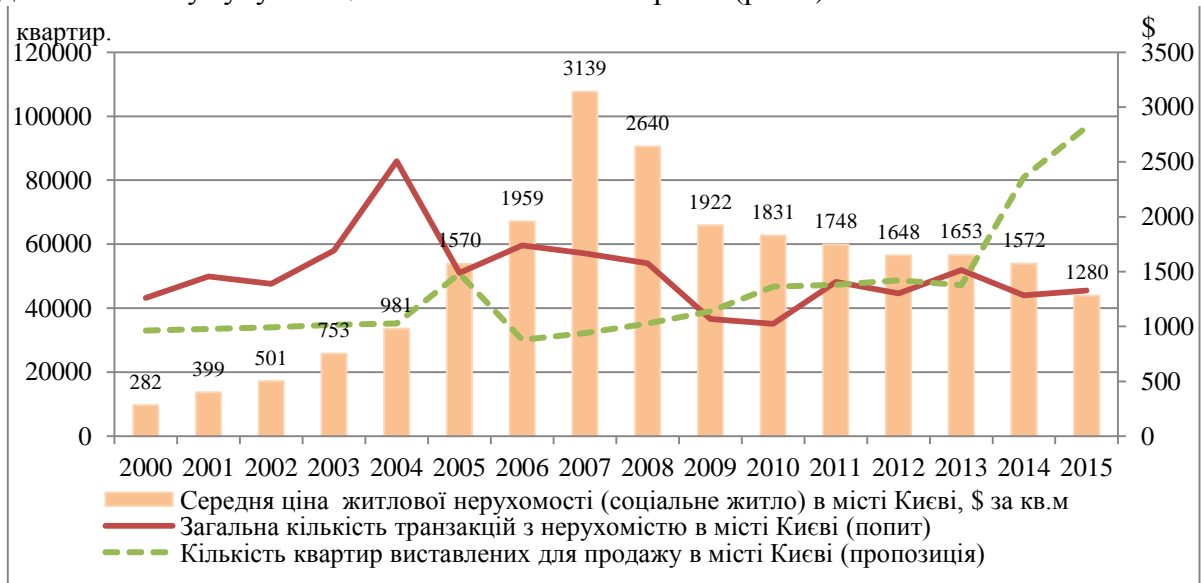
Рис. 2 – Кількість транзакцій та середня ціна на нерухомість у Києві за 2000-2015р.[за даними8]

Аналогічні процеси відбуваються і з ціною на нерухомість. Оскільки в Україні досі не створена єдина база даних щодо цін на нерухомість (з-за надзвичайної тінізації цього ринку), наведемо дані щодо середньої ціни житлової нерухомості (соціальне житло) в м. Києві. У 2007р. ціна сягала свого максимуму- 3139$ за кв.м, а у 2015р. – досягла мінімуму у 1280$ за кв.м за останні 10 років (рис.2):