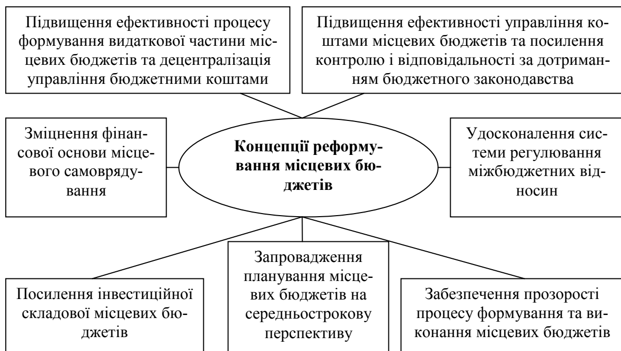
Рис. 2. Основні завдання Концепції реформування місцевих бюджетів

Така ж ситуація склалася і щодо розкриття інших основних завдань даної Концепції, що свідчить про відсутність розробленого чіткого механізму реформування місцевих бюджетів.