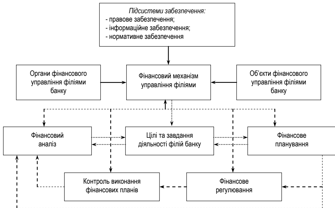
Рис. 2. Основні складові фінансового механізму управління філіями банку

Побудову схеми функціонування фінансового механізму управління філіями доцільно здійснювати на основі принципових підходів, а також змісту підсистем, розглянутих вище. На основі цих підходів нами запропонована структурно-функціональна схема побудови фінансового механізму управління філіями банку, наведена на рис. 2.