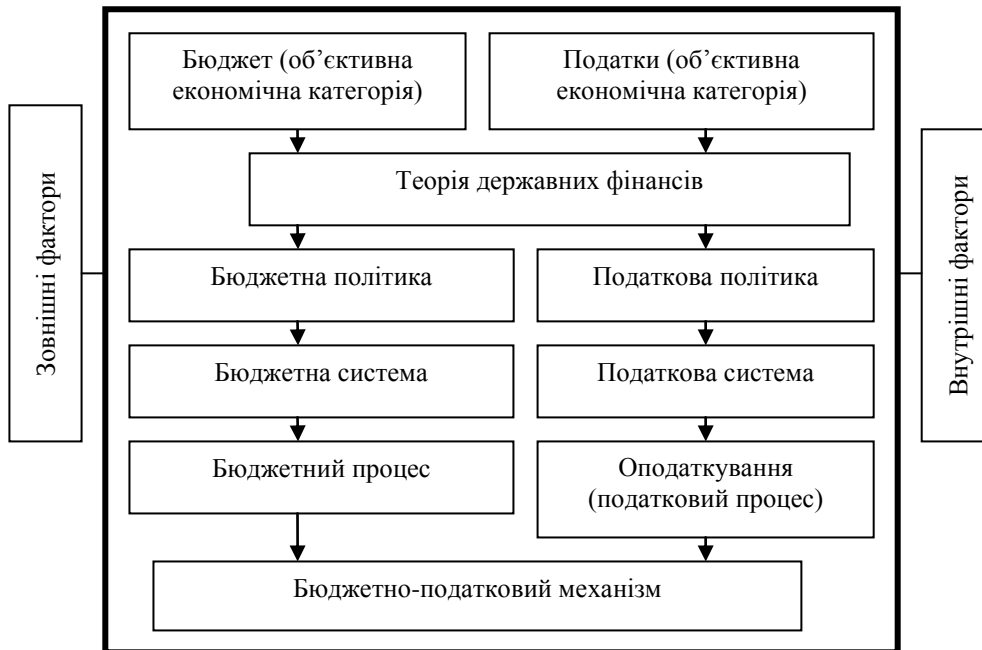
Рис. 1. Бюджетно-податкова політика в загальній системі державного регулювання

трансформації, що спостерігаються у країнах – нових членах ЄС, які є одними з головних конкурентів України на світових ринках товарів і капіталів.