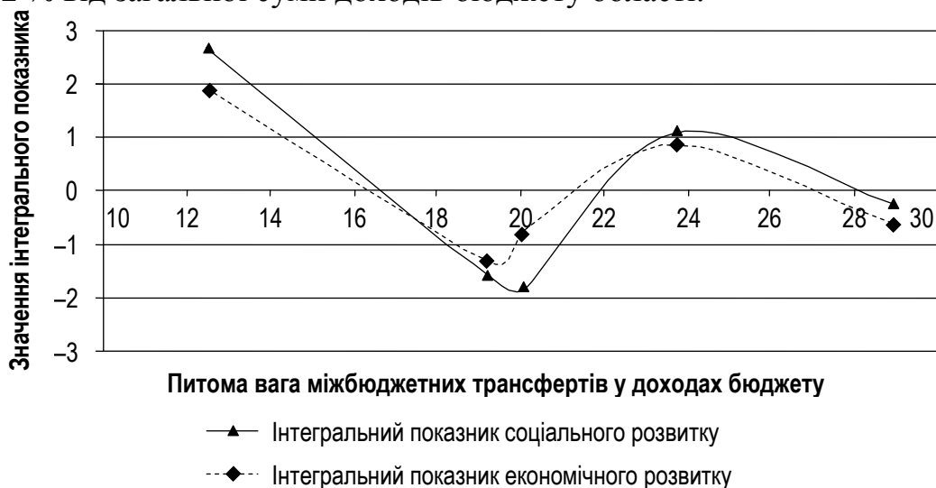
Рис. 4. Функціональна залежність інтегральних показників економічного (соціального) розвитку Дніпропетровської області від питомої ваги міжбюджетних трансфертів у доходах бюджету

На рис. 4 показано функціональну залежності Y \phi для інтегральних показників соціального (економічного) розвитку Дніпропетровської області. На основі результатів аналітичного дослідження для досягнення максимальних значень показників економічного і соціального розвитку Дніпропетровської області буде підтриманий обсяг міжбюджетних трансфертів на рівні 25,4-26,2 % від загальної суми доходів бюджету області.