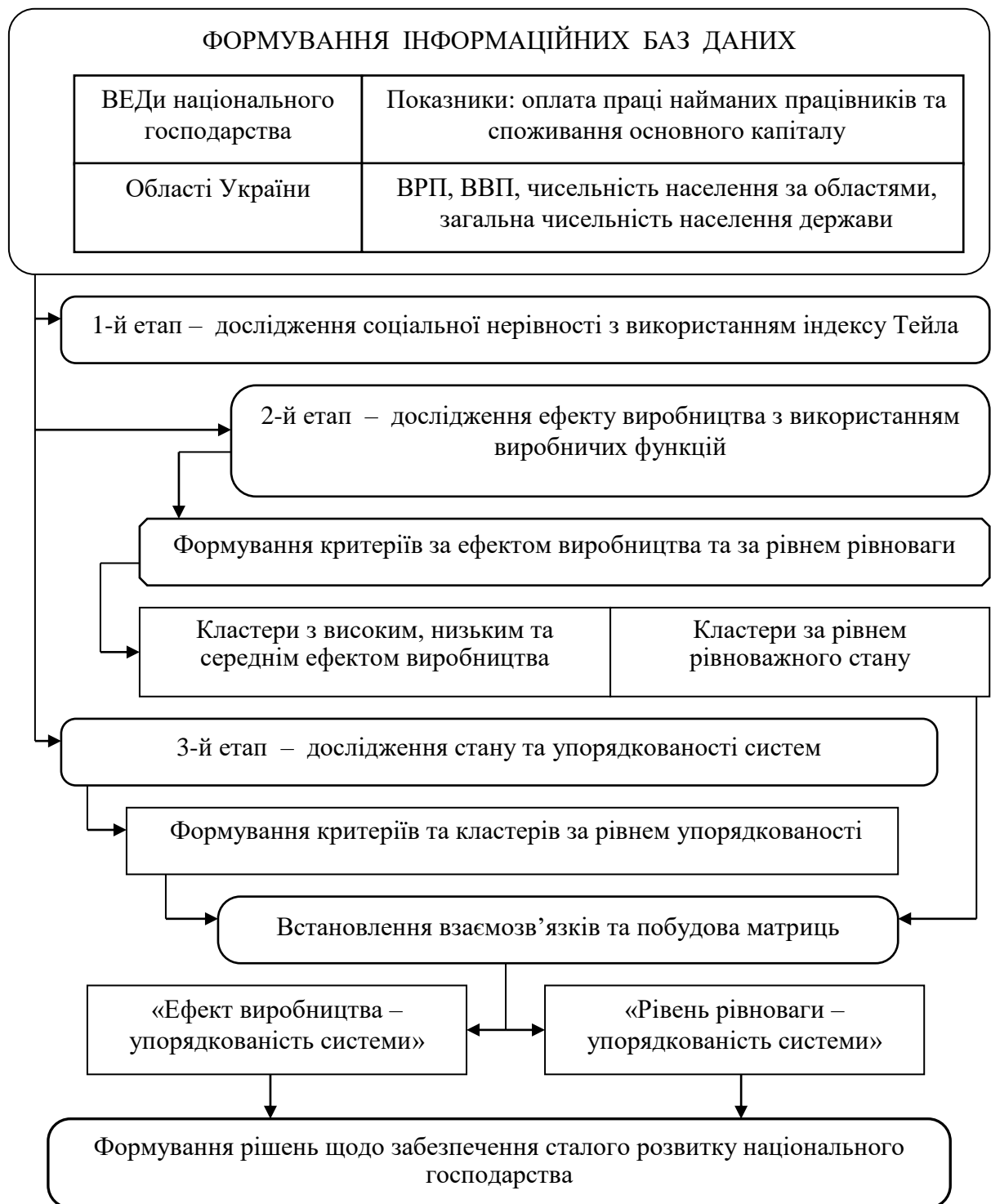
Рисунок 6.1 – Методика дослідження нерівномірності, упорядкованості та рівноваги у розвитку національного господарства

Вважаємо, що економічну систему, як відкриту систему, необхідно розглядати з позиції динаміки зміни її станів, а це потребує врахування ентропійного аспекту, який пов'язаний з безповоротністю економічних процесів.