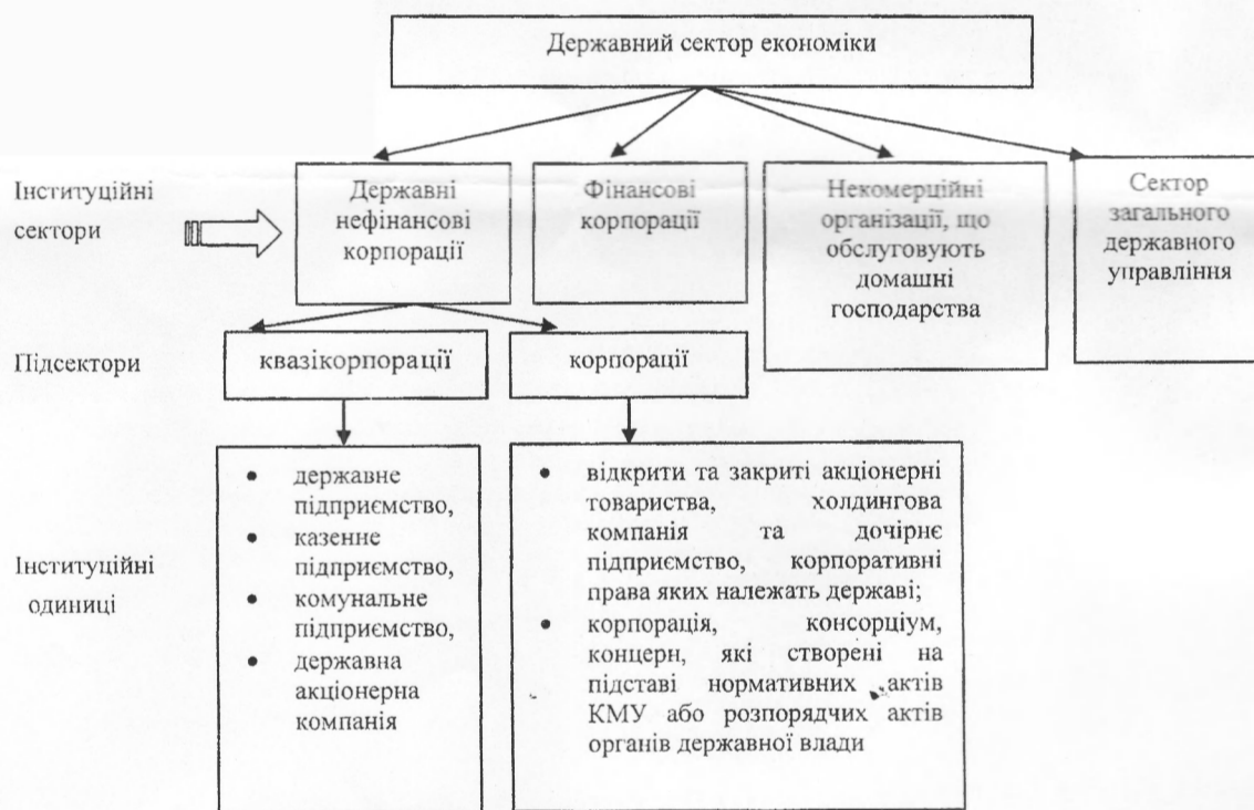
Рис. 3. Склад державного сектора за інституційними секторами економіки відповідно до Класифікації інституційних секторів економіки України

Склад державного сектора економіки відповідно до Класифікації інституційних одиниць представлено на рис. 3.