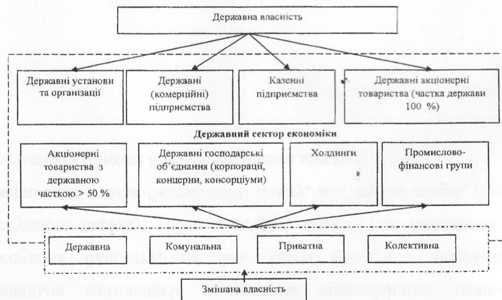
Рис. 4. Склад державного сектора економіки за формою власності

Як уже зазначалося вище, державний сектор економіки функціонує не лише на державній власності, а й в певній мірі на змішаній. Класифікація державного сектора економіки за формами власності представлена на рис. 4.