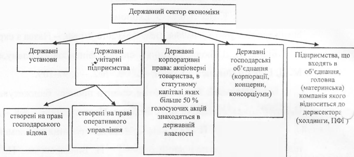
Рис. 1. Склад державного сектора економіки України відповідно до Господарського кодексу України

відповідно до статті 167 держава може створювати юридичні особи публічного права (державні підприємства, навчальні заклади тощо) та юридичні особи приватного права (підприємницькі товариства тощо), брати участь в їх діяльності на загальних підставах, якщо інше не встановлено законом [11]. Що стосується організаційно-правової форми, то, як уже зазначалося, держава має право створювати або приймати участь у створенні як некомерційних, так і комерційних підприємницьких структур різних організаційно-правових форм. Таким чином, ми можемо виокремити ще одну класифікаційну ознаку – ступінь автономії, що передбачає існування державних підприємств (установ, організацій) приватного та публічного права.