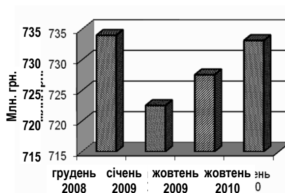
Рис. 3. Величина кредитів, наданих суб'єктам господарювання

Особливої уваги в аспекті регулювання ліквідності потребує кредитна політика банків, яка нині є не лише чинником збільшення ризиків ліквідності через дисбаланси в депозитно-кредитних операціях, а й негативно впливає на макроекономічну збалансованість та стимулює розвиток інфляційних процесів в Україні. Нині кредитні вкладення банків спрямовуються переважно у поточну діяльність суб'єктів економіки, їх питома вага у структурі кредитного портфеля банків становить 78 %, тоді як інвестиційні вкладення – лише 22 % (рис. 3).