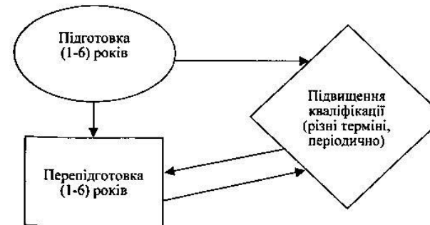
Рис.3. Основні види навчання фахівців.

Із всіх видів навчання (підготовка, перепідготовка і підвищення кваліфікації), якими користується Національний банк України, самою важливою в цих умовах є підвищення кваліфікації. Це не значить, що підготовка і перепідготовка втратили чи втрачають актуальність. Вони також важливі і необхідні, але для працівників Національного банку України підвищення кваліфікації є однією з основних форм навчання в умовах, які склалися. Для них це і певна перепідготовка для роботи в ринкових умовах, у світовій банківській системі, як це показано на рис.3.