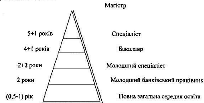
Рис.2. Освітньо-кваліфікаційні рівні підготовки банківських фахівців.

«Концепція» носить не директивний характер, а рекомендаційний. Тому для реалізації наміченого необхідна певна роз'яснювальна і організаційна робота.