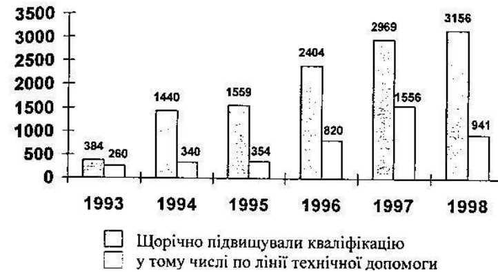
Рис. 4. Динаміка підвищення кваліфікації фахівців системи Національного банку України.

У складі банківських коледжів створено Регіональні центри підвищення кваліфікації та перепідготовки працівників банків України.