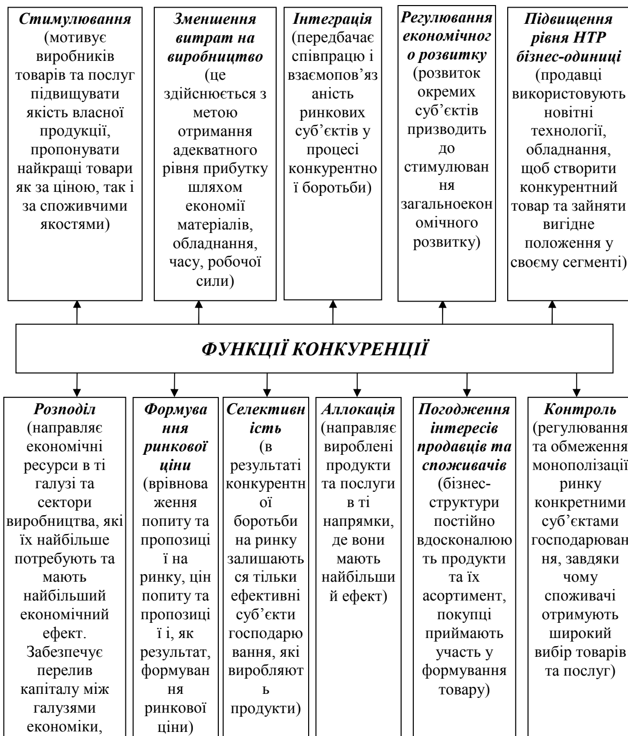
Рис.2. Основні функції конкуренції (складено автором на основі [8-13])

Конкуренція забезпечує вільне входження ринкових агентів в ту чи іншу сферу виробництва та послуг. Завдяки цьому економічна система має можливість вчасно пристосуватися до змін уподобань та смаків споживачів, розвитку науки й техніки. Важливим наслідком конкурентних відносин є те, що вони сприяють зростанню ефективності виробництва, стимулюють діяльність суб'єктів