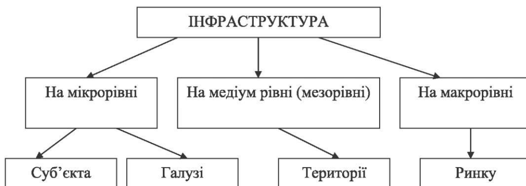
Рисунок 1 – Види інфраструктури

На медіумрівні («мезорівень») інфраструктура є сукупністю об'єктів або споруд, обслуговуючих певну територію: республіку, край, область, місто, селище, село. Це місцеві системи забезпечення