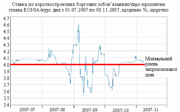
Рис. 2. Турбуленції

Це було першим, але недостатнім сигналом для поновлення довіри. Сама ситуація, а також зміни відсоткових ставок вимагали конкретних та сміливих дій. Рисунок 2 демонструє значні відхилення добової ставки відсотка порівняно з мінімальною купівельною ставкою, які розпочалися у першій половині серпня та навіть посилювалися на початку вересня 2007 року.