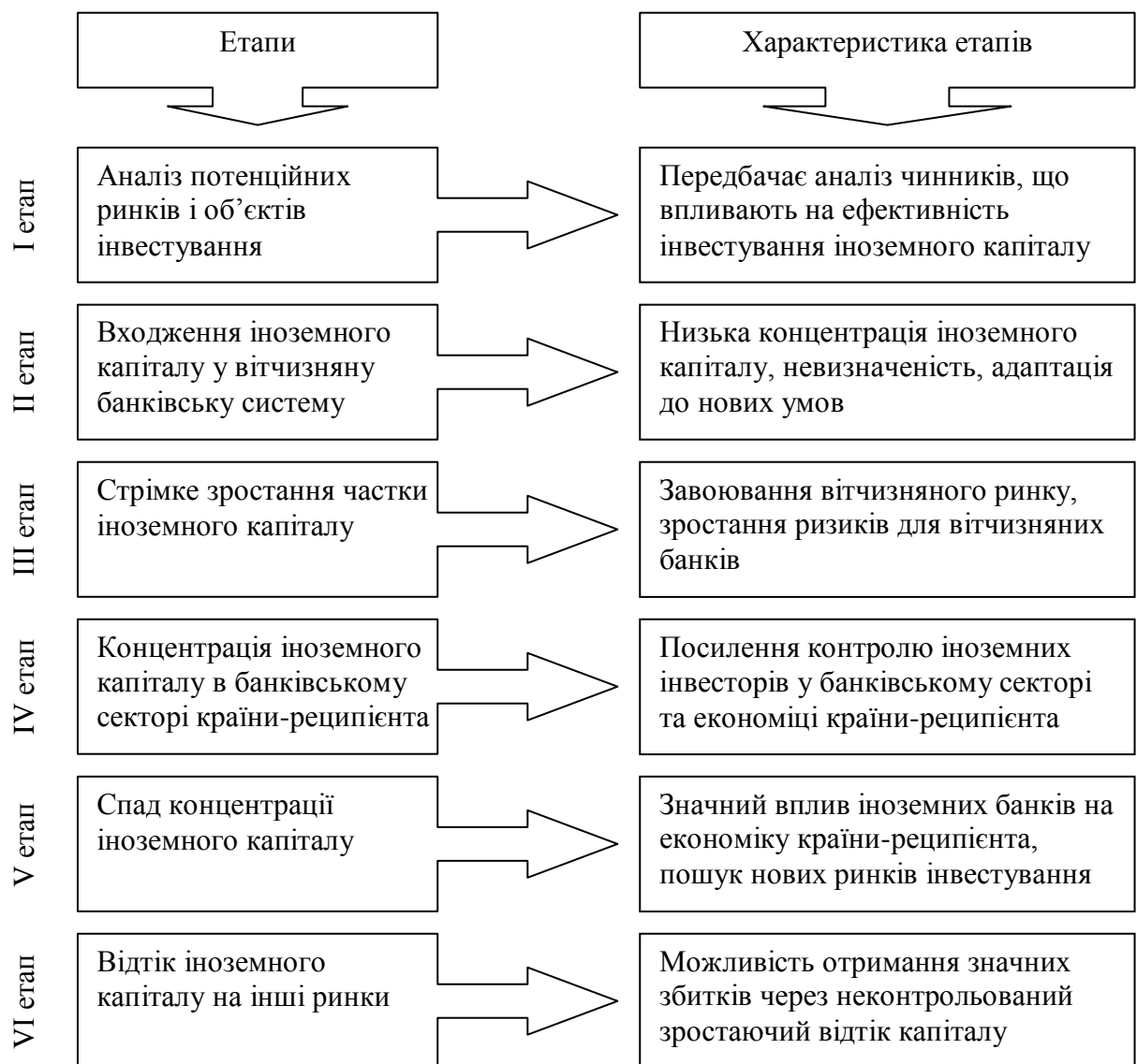
Рис. 3. Етапи проникнення іноземного капіталу в банківську систему

При цьому процес проникнення іноземного капіталу в банківську систему можна розподілити на декілька етапів (рис. 3): аналіз потенційних ринків і об'єктів інвестування, входження іноземного капіталу, стрімке зростання частки іноземного капіталу, концентрація, спад концентрації іноземного капіталу та відтік іноземного капіталу на інші ринки.