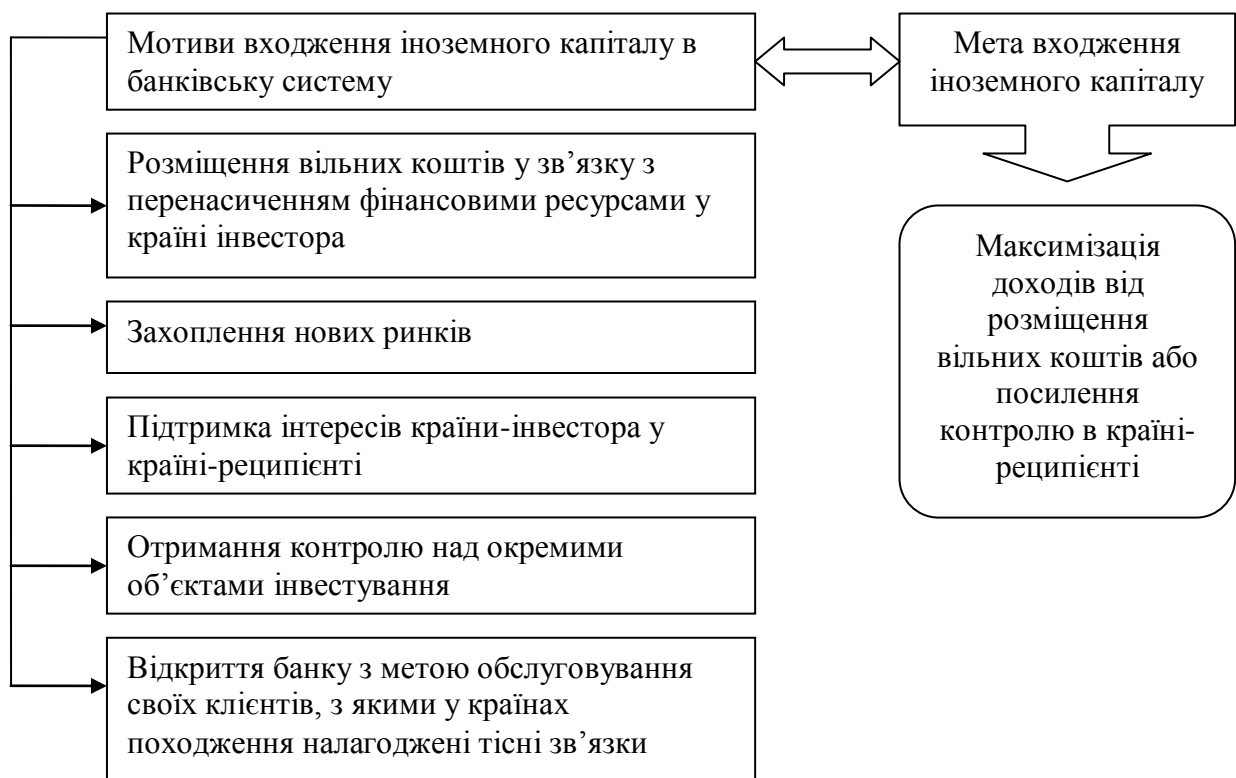
Рис. 2. Мотиви входження іноземного капіталу в банківську систему

Головною метою входження іноземного капіталу є або максимізація доходів, або посилення контролю в країні. При цьому мотиви входження іноземного капіталу в банківську систему країни-реципієнта можуть бути різними (рис. 2).