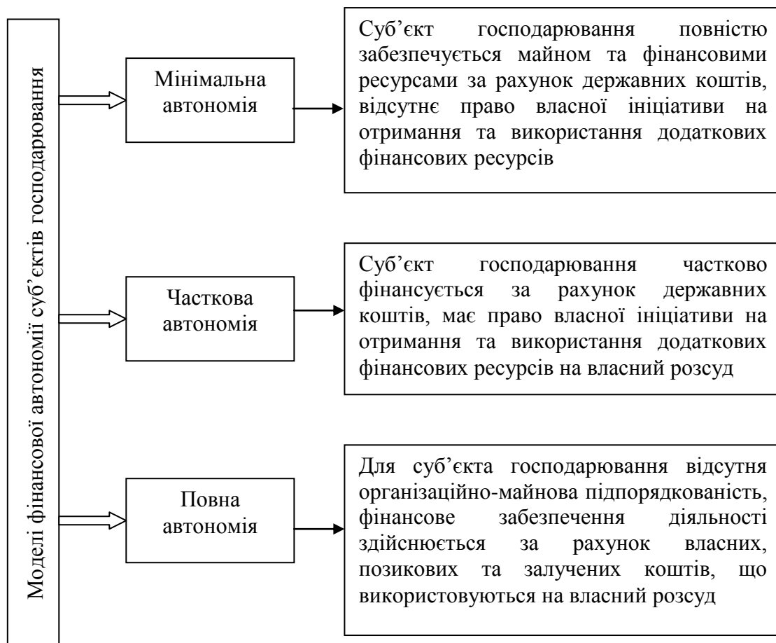
Рис. 3. Моделі фінансової автономії суб'єктів господарювання

Слід зазначити, що в світі існує декілька моделей фінансової автономії суб'єктів господарювання, а саме: мінімальної автономії, часткової автономії та повної автономії (рис. 3).