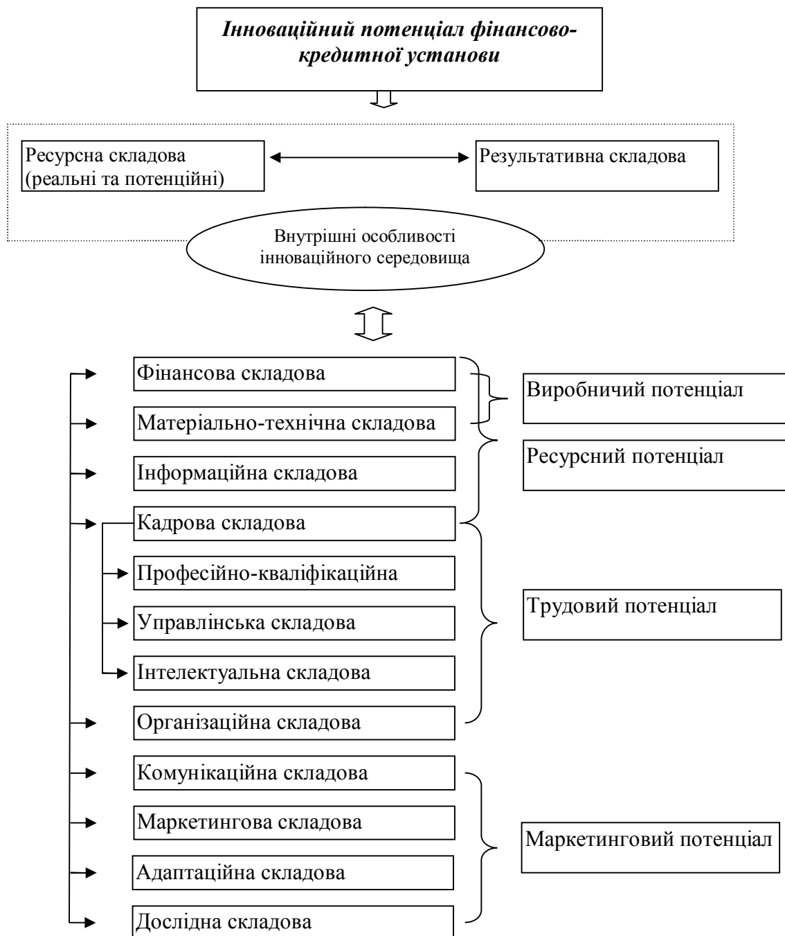
Рис. 2. Пропонований підхід до формування структури інноваційного потенціалу банківської установи

на, кадрова, організаційна, комунікаційна, маркетингова, адаптаційна, дослідна, які схематично представлені на рис. 2.