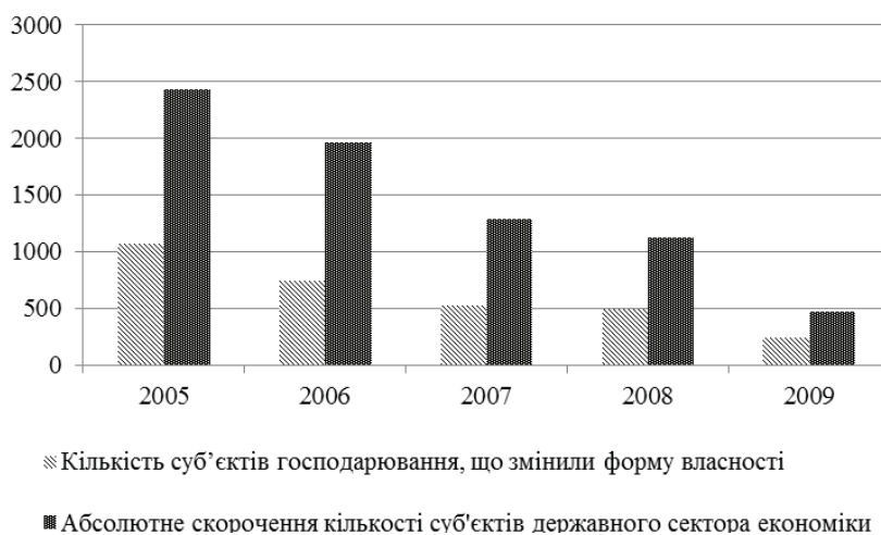
Рис. 2. Динаміка впливу трансформаційних процесів на обсяги державного сектора економіки

На сучасному етапі українську економіку визнано ринковою економікою змішаного типу, що функціонує на оптимальному співіснуванні різних форм власності, а саме: державної, комунальної, приватної та змішаної. В результаті чого на зміну хаотичному процесу формування державного сектора, що здійснювався за залишковим принципом, приходить розуміння необхідності проведення цілеспрямованої політики його побудови та глибокого реформування. Слід відмітити, що дії держави в реформуванні державного сектора спрямовані, в першу чергу, на оздоровлення даного сегменту шляхом продажу збиткових, малих та непривабливих об'єктів, а, відповідно, продаж великих та