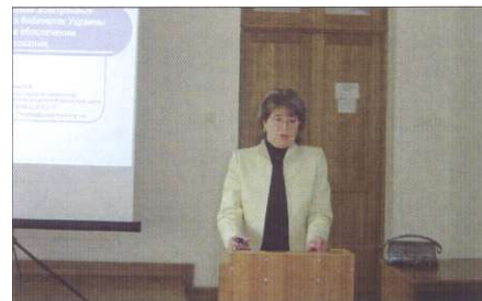
Презентація електронної бібліотеки УЛБС НБУ під час Міжнародного семінару "Віртуальна бібліотека: досвід та перспектива корпоративної роботи університетських бібліотек" у Мінську (Білорусь).

Із 2002 року фахівці працюють над забезпеченням через сервіси власного веб-сайту доступу до інформаційних ресурсів бібліотеки академії, інших книгозбірень та інформаційних центрів, над використанням ресурсів світового інформаційного простору.