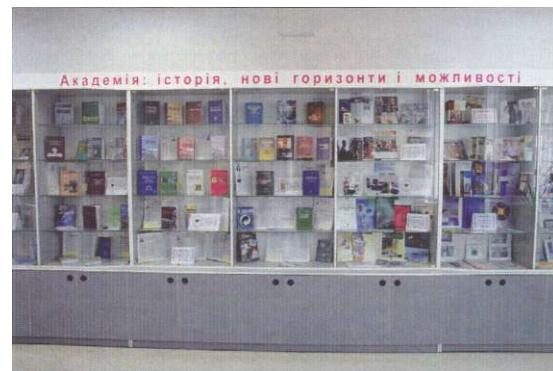
Інформаційний стенд "Академія: історія, нові горизонти і можливості"

З метою розширення академічного інформаційно-освітнього простору, спектра інформаційних послуг книгозбірня з 2001 року впроваджує проект "Електронна бібліотека УАБС НБУ для навчання і досліджень", який передбачає створення електронної бібліотеки академії на основі власних електронних колекцій.