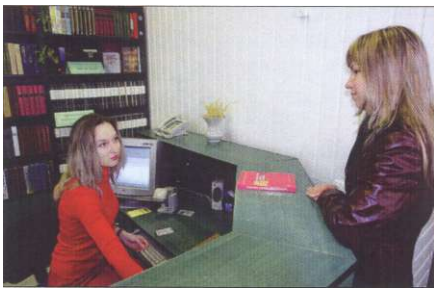
Автоматизоване обслуговування читачів здійснюється на всіх абонементних і в читальних залах бібліотеки.

ту і нормами книгозабезпеченості студентів, встановленими нормативними документами Міністерства освіти і науки України.