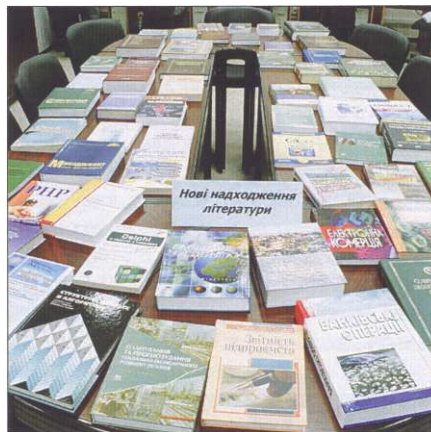
Нові надходження літератури.

Проведене нами анкетування стосовно використання "Електронної бібліотеки УАБС НБУ" засвідчило, що характер одержання інформаційних ресурсів суттєво змінюється: все більше студентів та викладачів надає перевагу самостійній роботі з використанням комп'ютерних технологій та віддаленого доступу.