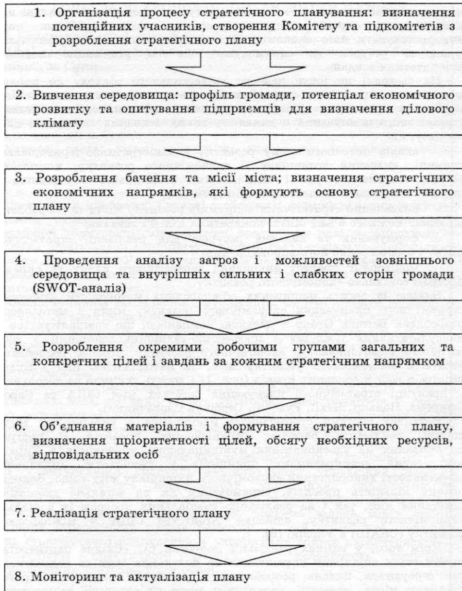
Рисунок 1 - Методологія стратегічного планування економічного розвитку міста, розроблена Vestan Group

Важливим кроком у становленні та розвитку системи стратегічного планування соціально-економічного розвитку українських міст стала реалізація проекту «Економічний розвиток міст», що проводився за підтримки Агентства США з міжнародного розвитку (ЦБАГО). У рамках цього проекту фахівці ХІБАШ співпрацювали з органами місцевого самоврядування 76 міст України з метою визначення стратегій економічного розвитку та реалізації економічного потенціалу міст для забезпечення довгострокового їх розвитку, у тому числі шляхом збільшення обсягів залучення інвестицій та створення нових робочих місць.