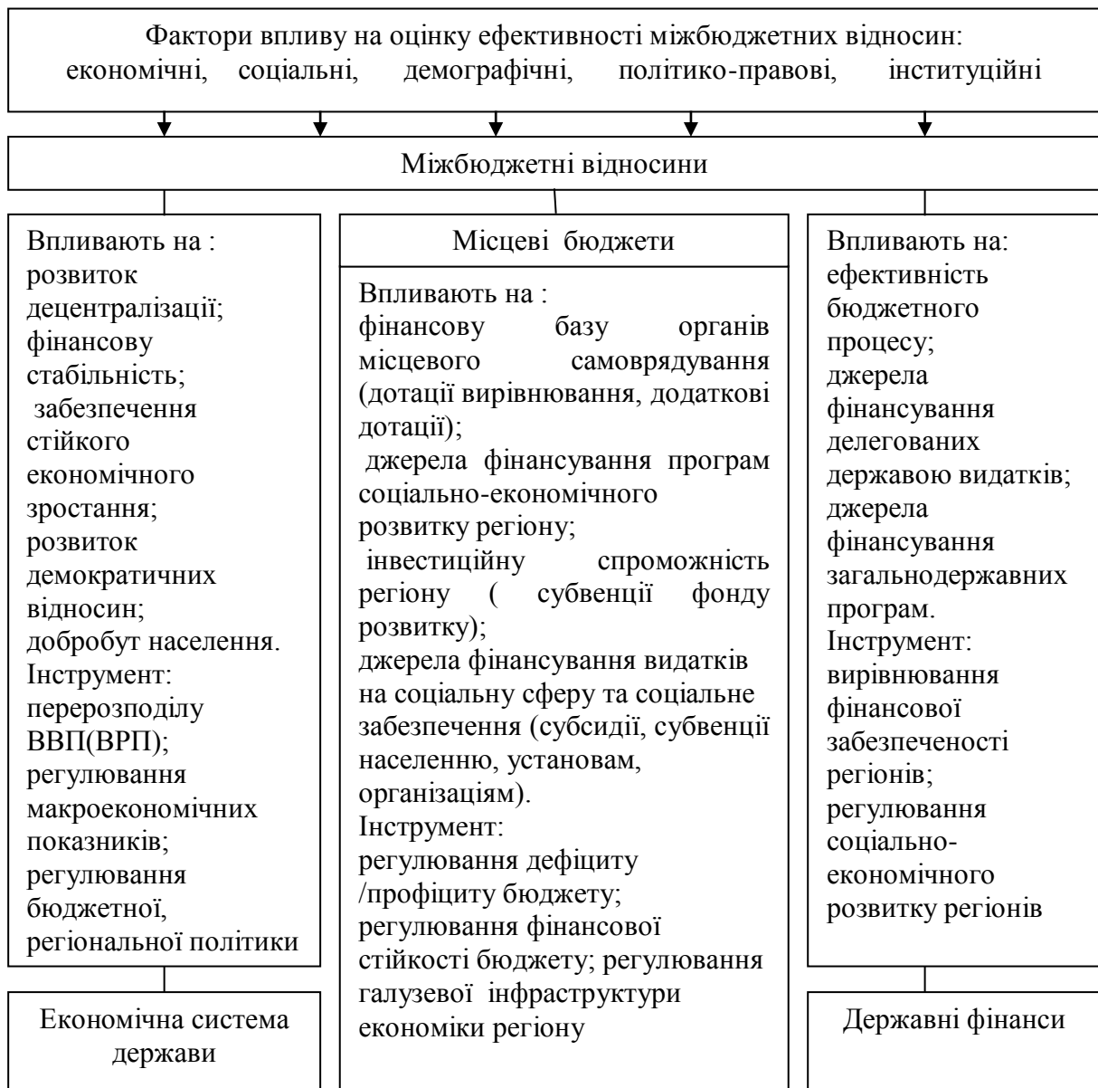
Рис. 1 Роль міжбюджетних відносин у забезпеченні соціально-економічного розвитку регіону

Структуроформуючими ознаками соціально-економічного стану територій пропонуються показники добробуту і життєвого рівня населення [3, 4], що враховують розвиток територій за інвестиційними, фінансовими, зовнішньоекономічними, науково-технічними, структурними ознаками [5], показники фінансової забезпеченості регіону [6]; рівня бюджетного фінансування, фінансової самостійності територій за напрямками: податкова самостійність, бюджетна самостійність, самостійність у галузі тарифного регулювання та політики ціноутворення [7]; оцінки ефективності місцевих бюджетів за критеріями економічна ефективність, соціальна ефективність, фінансова продуктивність [8], оцінки бюджетного потенціалу[9], індексу людського розвитку[10].