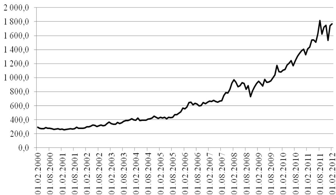
Рис. 2. Зміна світової ціни на золото за період 2002-2012 років (за даними World Gold Council [ http://www.gold.org/investment/statistics/gold_price_chart/ ])