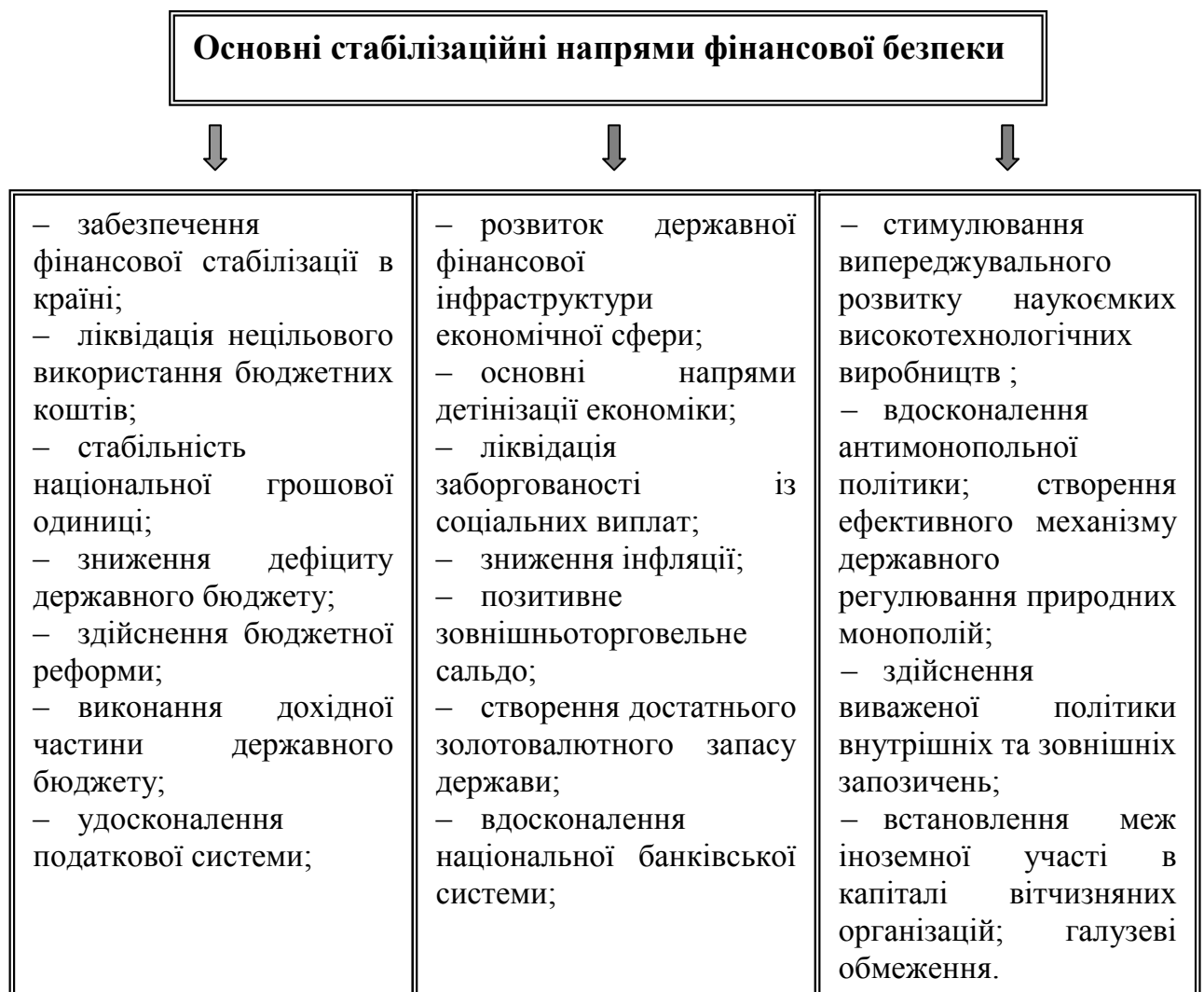
Рис.1. Основні стабілізаційні напрями фінансової безпеки

Узагальнення думок учених і експертів щодо джерел виникнення загроз економічній безпеці дає змогу стверджувати, що головна загроза полягає у відсутності цілеспрямованої політики державного регулювання економічними процесами в контексті реалізації проголошених стратегій соціально-економічного розвитку країни. Визначальним у проведенні економічних реформ повинно стати поєднання прагматичної політики захисту національних інтересів з конструктивним курсом на зростання добробуту широких верств населення країни. Матеріальною основою цього процесу має бути відродження та прискорений розвиток перспективних секторів національної економіки.