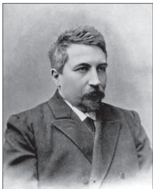
Фото 1. Редін Єгор Кузьмич (1863–1908). Фото поч. XX ст.

Курської губ[ернії]. Батько його, що пережив сина на півроку, був людиною розумною. Мати Є[гора] К[узьмича] рано померла, вона була жінкою простою, доброю, від природи розумною. Покійний вдячно згадував про неї /.../: “Мамо, любя мамо! Я не можу тебе забути. Твій дорогий образ постає переді мною... Ти любила нас більше ніж себе”, – і далі вкла-