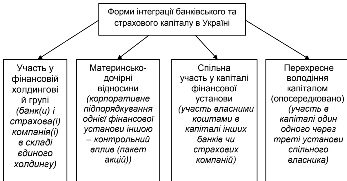
Рис. 1. Загальний зміст форм інтеграції банківського та страхового капіталу в Україні (сформовано на основі джерел [4, 5, 8])

За даними НБУ про власників істотної участі в статутному капіталі 15 банків зареєстрована пряма участь вітчизняних та іноземних страхових компаній в загальному обсязі близько 570 млн. грн. При цьому лише в одному банку (ПАТ «Банк ринкові технології», м. Київ) страхова компанія (ПрАТ «Страхова компанія «Стар-Поліс») володіє сто відсотковим пакетом акцій. В трьох банках («ПАТ «Реал Банк», ПАТ «Мотор-банк» та ПАТ «Ерде Банк») страхові компанії прямо володіють контрольними пакетами їхніх акцій. Однак, поки що спостерігається участь страхових компаній в статутних капіталах лише середніх та малих банків. Питома вага їхньої участі в сукупному капіталі банків України становить лише 0,34 % [1].