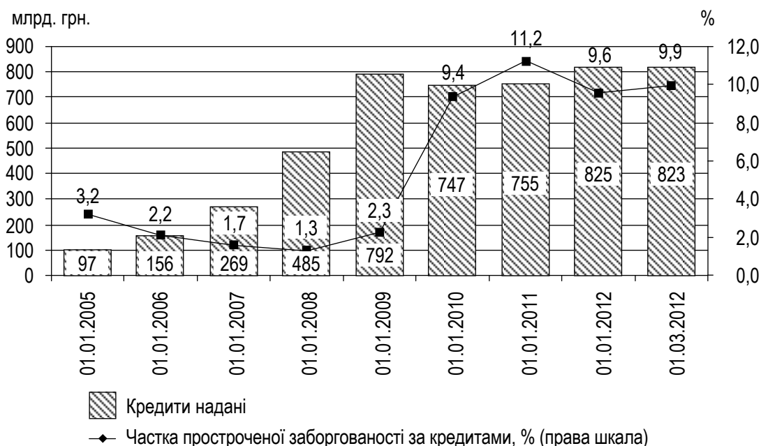
Рис. 1. Динаміка обсягів кредитного портфеля та частки простроченої заборгованості по банківській системі України

Статистичні дані діяльності банків України засвідчують, що до 2008 року простежувалась стійка тенденція до зниження частки проблемних кредитів у кредитному портфелі та спостерігалось значне поліпшення структури кредитного портфелю вітчизняних банківських установ, і на початок 2008 року проблемні кредити становили всього 1,3 % від загального обсягу кредитного портфелю банків, а в абсолютному вираженні це складало 6,4 млрд. грн. (рис. 1).