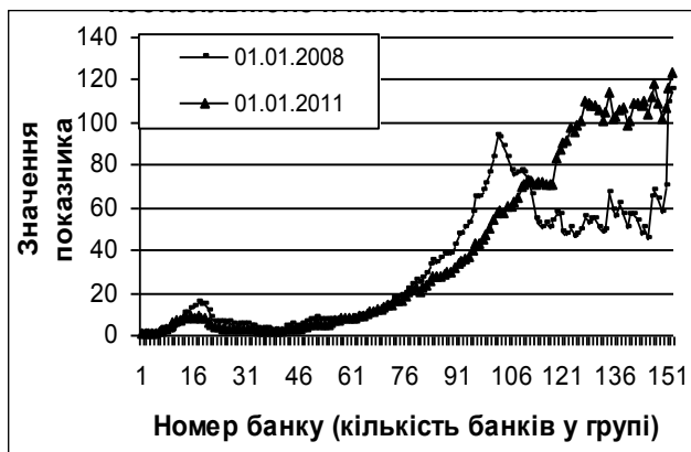
Рис. 3. Співвідношення між індивідуальною нестабільністю n -го банку та груповою нестабільністю n найбільших банків

групі з n найбільших банків, – надалі VTS-індекс. Графічне представлення VTS-індексу для системи перед кризою та після неї наведено на рис. 3. Як видно на рис. 3, відносна стабільність банків з 1 до приблизно 70-го внаслідок кризи якісно практично не змінилась. До того ж для групи банків з 1 до 38 значення VTS-індексу зменшилося, що можна трактувати як ознаку більшої консолідації банків, що належать до I та II груп банківської системи України. Що ж до банків після 70-го, то фінансова криза призвела до того, що нестабільність частки активів малих банків зараз зростає тим більше, чим менше сама частка активів, що, як нам здається, свідчить про зростаючу уразливість щонайменше 80 малих банків системи.