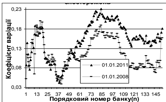
Рис. 1. Значення коефіцієнта варіації частки активів n -го банку за 7 і 10 років спостережень

І в першому, і в другому випадках як показник стабільності використовувався коефіцієнт варіації відповідних часток активів.