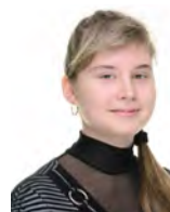
Сторінку підготувала Валерія РЕЧЕМБЕЙ, студентка групи ЕК–31

УАБС НБУ – це нові друзі, знайомства та незабутні враження! Академія – це завжди якийсь рух, безліч заходів і несподіванок. Першокурсникам бажаю не лінуватися, а гарно та наполегливо вчитися.