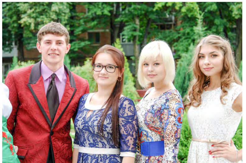
Серед найкращих вокалістів академії