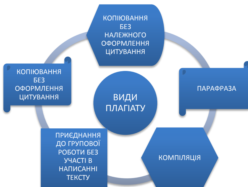
Рис. 2. Види плагіату

обману: виправлення текстів з метою приведення їх у вигляд самостійного дослідження.