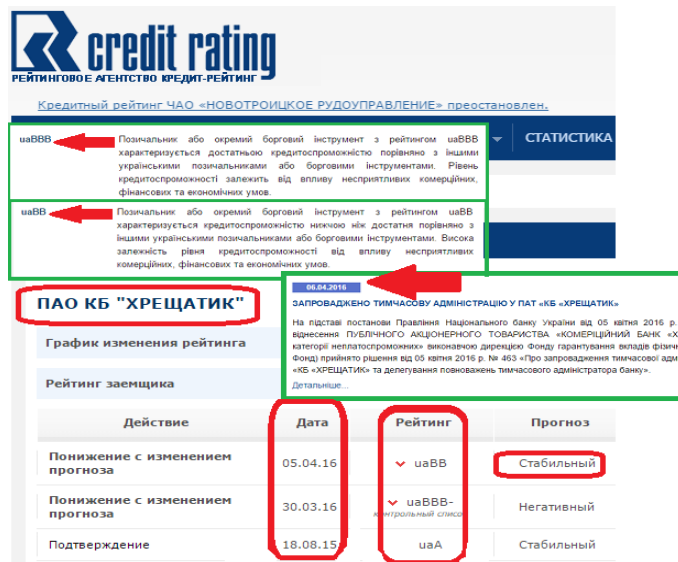
Рисунок 2 – Фрагмент рейтингового оцінювання банку ПАТ КБ «Хрещатик» агентством ТОВ «Кредит-Рейтинг» [19]

2016 р., «Кредит-Рейтинг» оприлюднило рейтингову оцінку, яка висвітлює звичайно не найкращі прогнози банку, але до оцінки з явними ознаками дефолту за національною шкалою ще залишається понад 5 позицій [19].