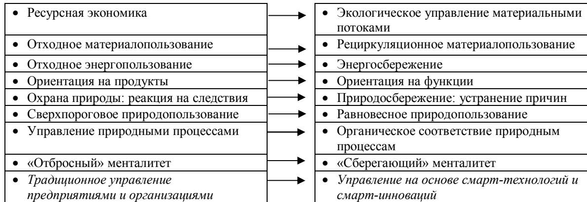
Рис. 1. Схема концептуальных инновационных направлений формирования задач дематериализации (усовершенствовано авторами на основе работы [5])

На основании анализа источников отечественной литературы установлено, что в современной научной литературе теоретико-методологическим и методическим вопросам информатизации, ресурсосбережения, экологизации социально-экономических систем уделяется достаточно большое внимание, что получает свое дальнейшее развитие в области исследования процессов дематериализации [16].