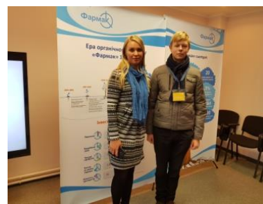
Рис. 1 Вивчення сучасних технологій замкнутого циклу виробництва «Фармак»

Отже, подальший розвиток та впровадження винаходів в сфері фармації сприятиме динамічному соціально-економічному розвитку міста та країни.