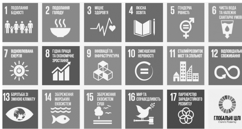
Рис. 3. Склад Глобальних цілей сталого розвитку [16]

• Підприємство «ОблСіч» обласного Громадсько-соціального об'єднання «Асамблея інвалідів Черкащини» (м. Черкаси). Сфера його діяльності – охорона здоров'я, а саме проведення фізично-оздоровчих заходів та виробництво технічних засобів реабілітації. Комерційна складова діяльності компанії полягає у зборі коштів її учасників для виробництва оздоровчих жилетів у розстрочку за індивідуальними замовленнями самих учасників, при цьому 100% прибутку організації спрямовується на соціальні цілі. Результатом діяльності соціального підприємства в останні роки стало оздоровлення 750 осіб, забезпечення підтримки належного стану здоров'я людей з різним ступенем інвалідності.