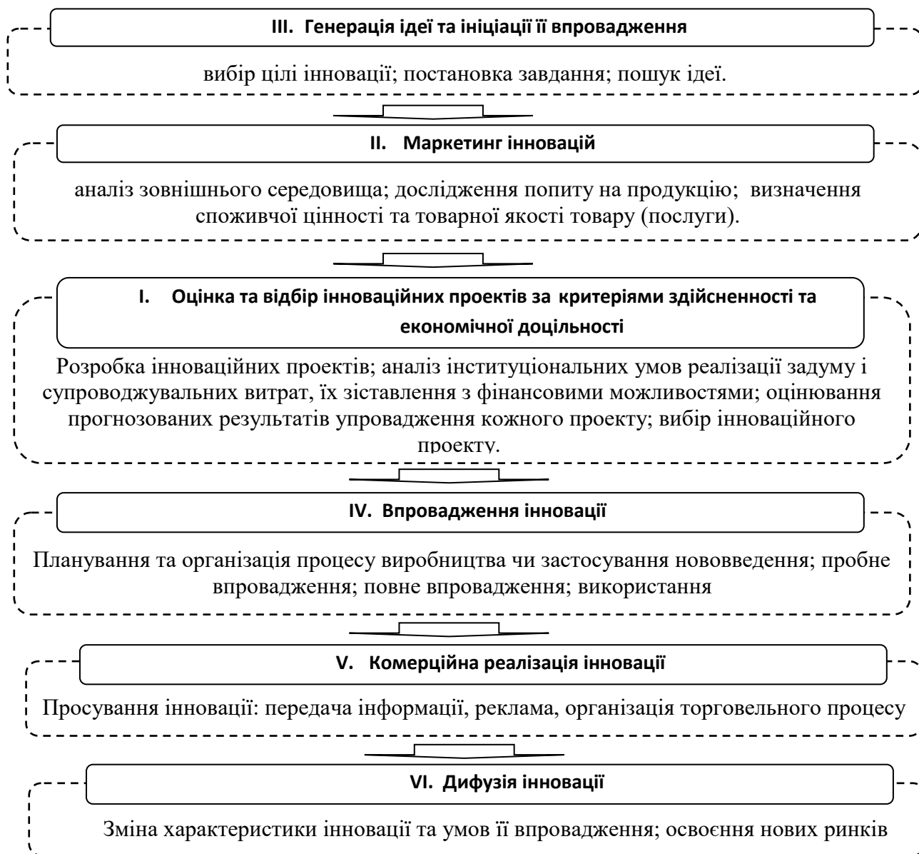
Рис 1. Алгоритм реалізації інноваційного процесу

міжорганізаційному інноваційному процесі новація виходить за межі організації і стає предметом купівлі-продажу. Розширений інноваційний процес базується на порушенні монополії та появі додаткового виробника, що у свою чергу сприяє удосконаленню властивостей нововведення. На рис. 1 відображено алгоритм реалізації інноваційного процесу.