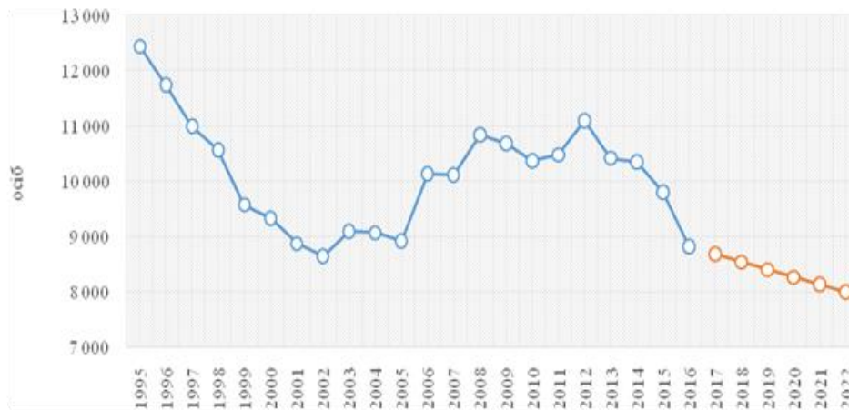
Рисунок 1 – Кількість новонароджених в Сумській обл. тис. осіб: ретроспектива за 1995-2016 рр. та прогноз на 2017-2022 рр.

На рис. 1 представлені не лише ретроспективні дані за 1995-2016 рр., а й зроблені нами прогнози на 2017-2022 рр. (при умові, що будуть збережені існуючі тенденції).