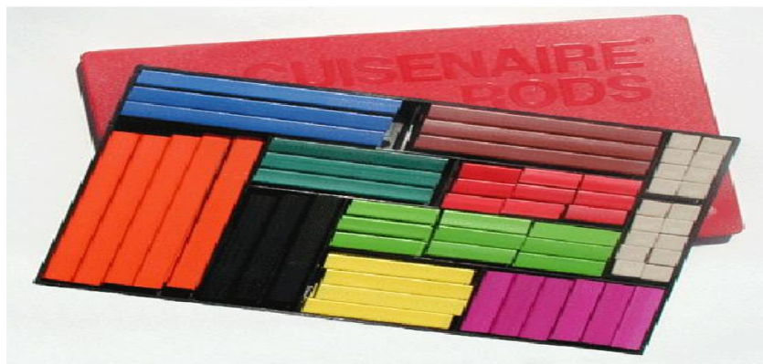
Рис. 1.1 Рахункові палички Кюізенера

у реченні, для реалізації більшості граматичних структур мови вивчення, розбору речень та словесних наголосів, беручи до уваги правильність інтонації та зв'язки у словосполученнях, для створення візуальної моделі конструкцій (наприклад, системи часових форм дієслова в англійській мові), для показу фізичних об'єктів (годинників, карт, тварин, овочів, тощо), які в подальшому використовуватимуться для створення учнями оповідань чи історій як у відео.