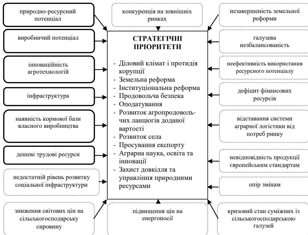
Рис. 2. Схема систематизації проблемних (позначені пунктирними прямокутниками) та перспективних (позначені потовщеними прямокутниками) факторів на стратегічні пріоритети розвитку АПК в Україні [розроблено авторами]

Проаналізувавши проблемні та перспективні фактори розвитку АПК України, ми провели їх систематизацію (рис. 2).