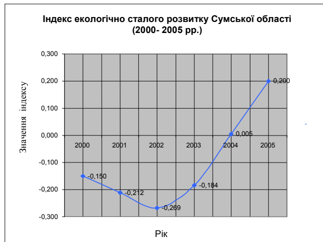
Рис. 3. Динаміка індексу екологічно сталого розвитку Сумської області