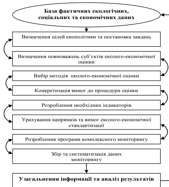
Рис.1. Схема комплексного моніторингового дослідження стану регіону

Оцінка стану регіону передбачає наявність інформаційно-аналітичної бази, яку пропонується формувати на основі існуючої системи моніторингу, що забезпечить повну, достовірну та своєчасну інформацію про стан його екологічної, соціальної та економічної підсистем. В Україні проводяться два види моніторингових досліджень: екологічний та соціально-економічний. При цьому спільний аналіз даних, отриманих у результаті цих видів моніторингу, практично відсутній. Саме оперативна оцінка змін, що відбуваються у регіоні, та своєчасна реакція на негативні тенденції таких змін можуть забезпечити оптимальний процес прийняття відповідних управлінських рішень. У зв'язку з цим необхідним є формування комплексної системи моніторингу, яка відрізняється від існуючої цільовим характером спостереження з урахуванням екологічної, соціальної та економічної інформації і розрахунком інтегральних індикаторів розвитку.