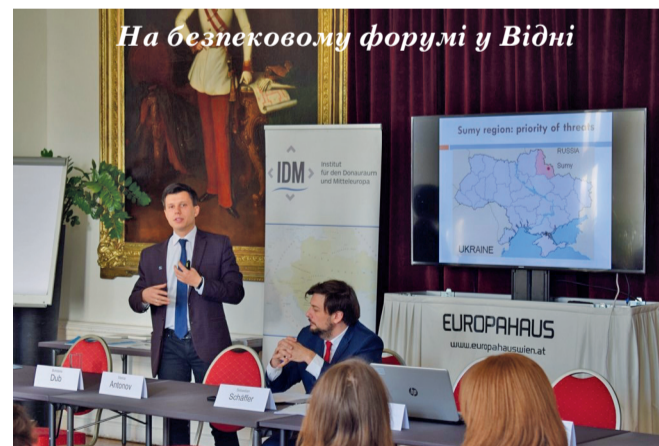
На безпековому форумі у Відні

науковими центрами, громадськими організаціями, органами місцевого самоврядування. Обов'язково продовжуватимемо інформувати сумчан щодо європейської та євроатлантичної інтеграції України. Також плануємо розробити додаткові навчальні курси з питань